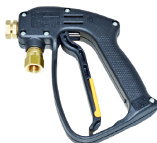
Pistolet typu RL 16