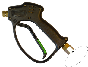
Pistolet typu RL 26 ze złączem obrotowym