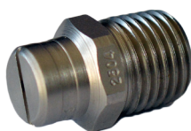
Dysza strumieniowa wody 25°