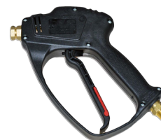
Pistolet typu RL 35