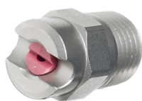
Dysza strumieniowa wody ceramiczna 40°