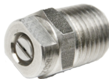
Dysza strumieniowa wody 65°