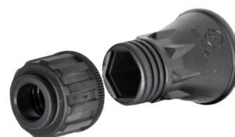
Osłona do dyszy